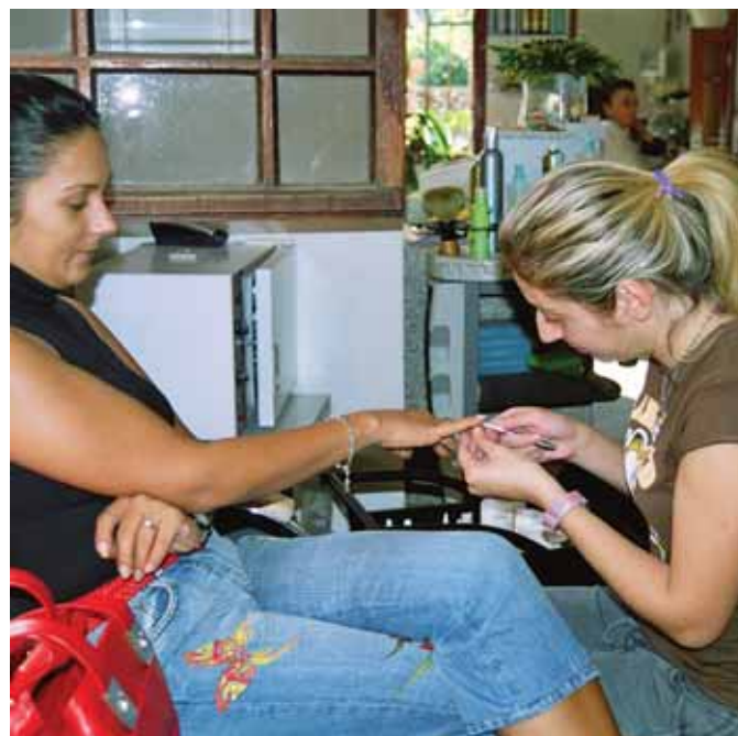
Både tatovering og manikyr under tvilsomme forhold i utlandet øker faren for å pådra seg hepatitt B-smitte og HIV.