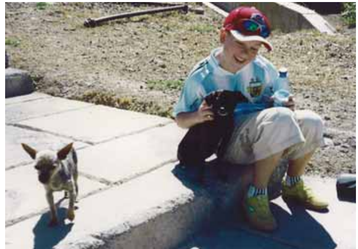
Den største faren for liv og helse er det trafikken som utgjør. Fristende kan det være, men unngå å klappe ukjente hunder.

Hvis du er uheldig og likevel får diaré, så er det viktig at du får i deg nok væske. Drikk gjerne mineralvann, cola eller te, men det ideelle er om væsken inneholder både sukker og salt, for eksempel en blanding av eplemost og Farris. Unngå melk og vent med å spise til diaréen er overstått. Loperamid-preparater kan brukes som stoppende middel, men vent gjerne et døgn eller to da det kan virke svært forstoppende. Disse preparatene skal imidlertid ikke brukes av barn. Dersom du har høy feber og/eller blodig diaré bør du kontakte lege.