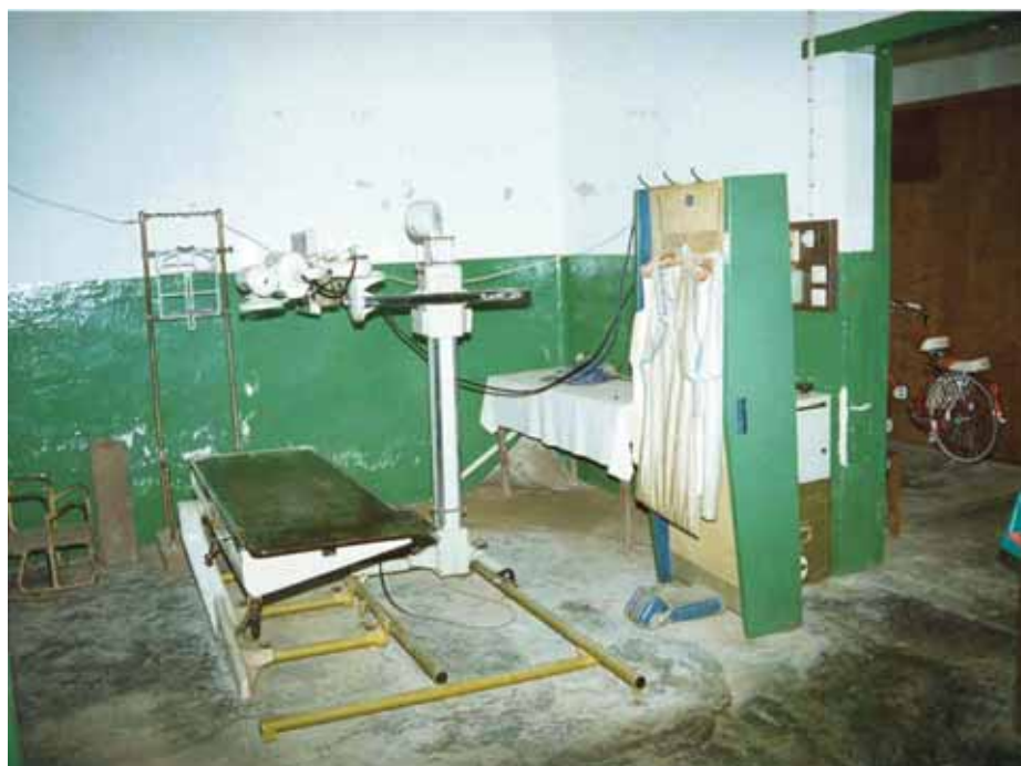
Å havne på sykehus i utlandet er en risiko i seg selv...