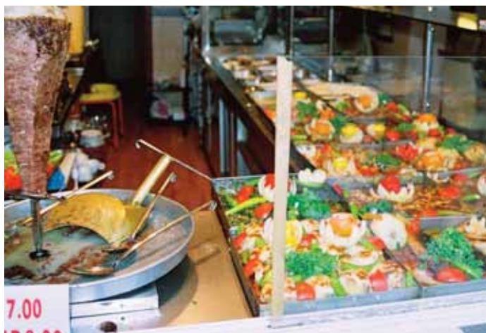
Bufféer og annen mat som har stått lenge fremme, bør man unngå å spise.

Unngå bufféer og salater i den grad det er mulig. Spis ikke rå eller ikke-gjennomstekt fisk eller kjøtt. Er kyllingen rød langs benet så send den ut til kokken igjen. Vann fra springen er tabu de fleste steder.