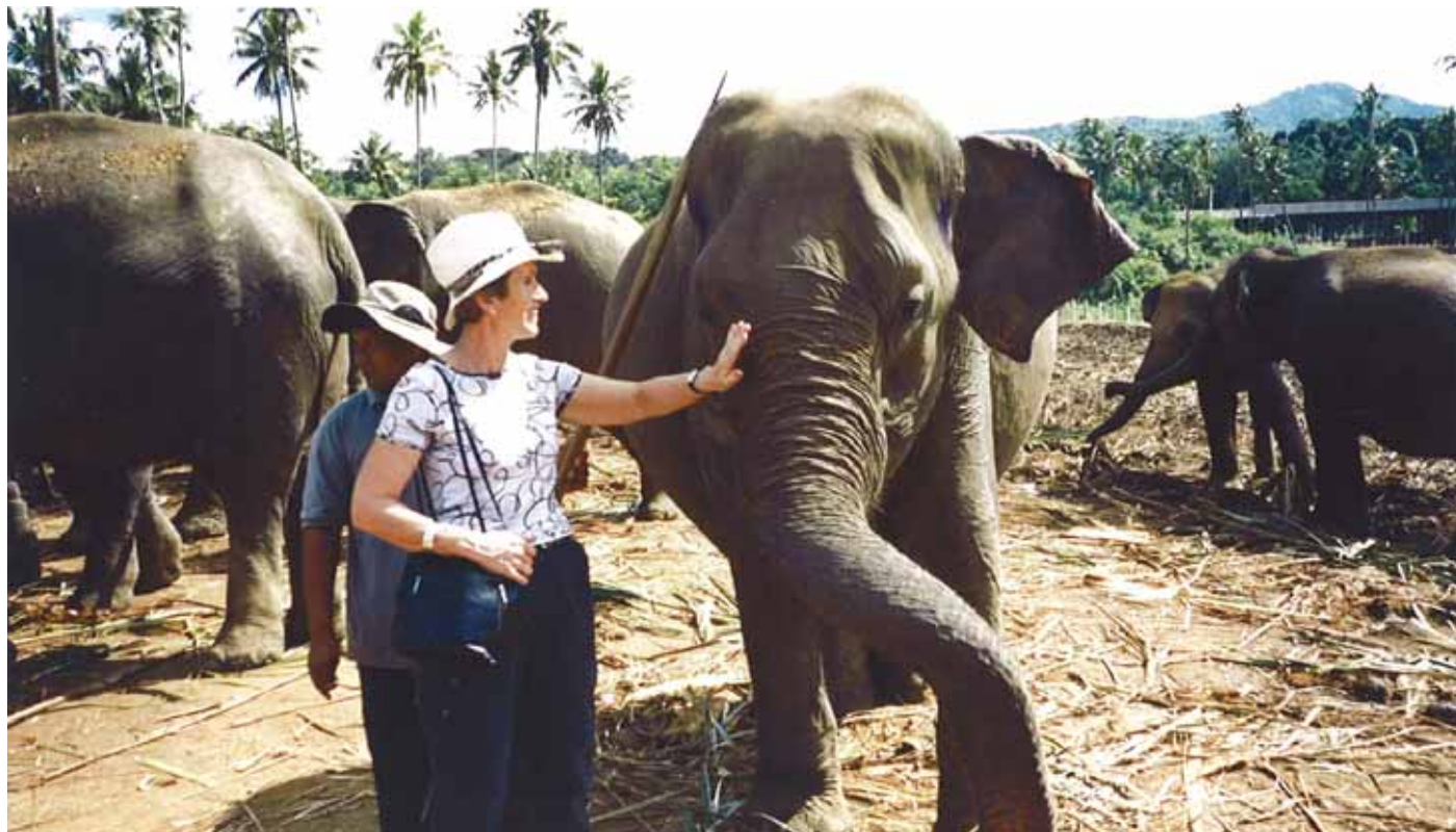
Husk hodebeskyttelse mot den sterke solen, og pass for all del på håndvesken!

Enkelte kroniske sykdommer vil ikke være dekket av vanlig reiseforsikring. Hvis du er i tvil bør du kontakte ditt forsikringssselskap for å forsikre deg om at du vil være dekket om du skulle havne på sykehus.