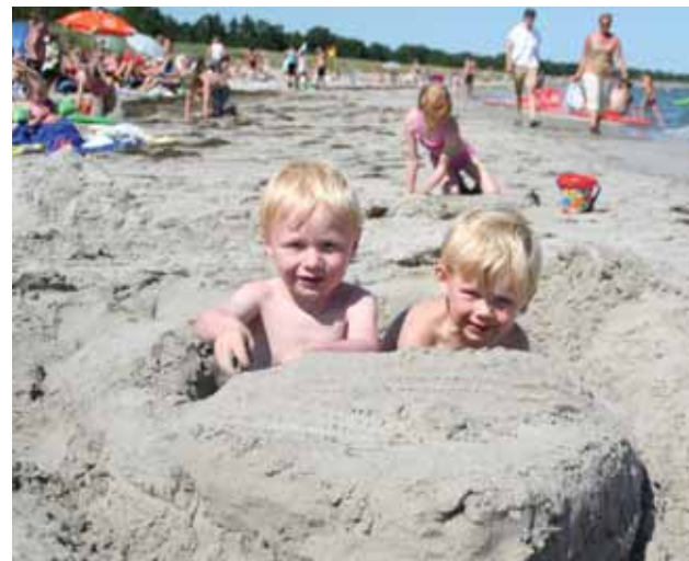
For de aller yngste holder det lenge med en tur til et påv våre naboland, om man i det hele tatt skal forlate hjemlandet.