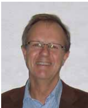
Lege Harald Hauge