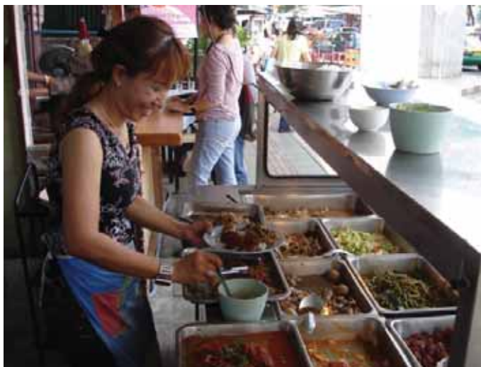
Det som lukter godt, ser godt ut og smaker godt – og som du ser alle andre spiser – er som regel OK.

eller redusere plagene som oppstår ved å krysse flere tidszoner. Hvilke forholdsregler du tar, kommer litt an på hvor lenge du skal være borte. Forretningsreisende som snart skal hjem igjen, bør unngå å snu døgnet til lokal tid. Skal du være borte i lengre tid, kan du justere døgnet litt på forhånd, selv om det fremfor alt er dagslyset som styrer din døgnrytme. Ellers hjelper det å være uthvilt, helst sove godt før avreise, og ellers holde deg unna alkohol.