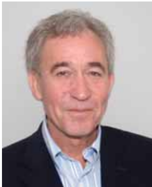
Lege Sverre Kjølstad