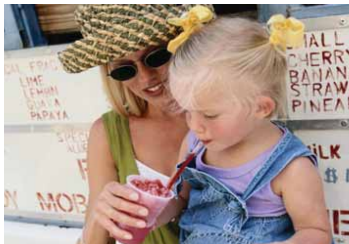
Visst smaker det ekstra godt med is i varmen, men den bør ikke kjøpes hvor som helst.