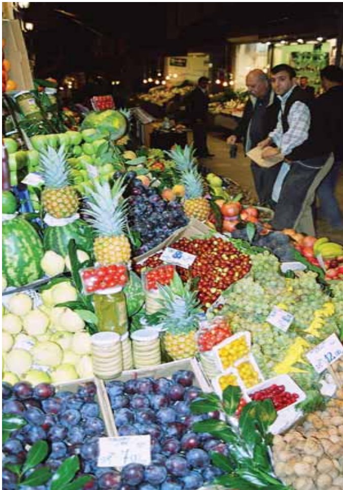
Frukt som du selv skreller, som bananer, appelsiner og mango, er alltid trygt å spise.

– Søk gjerne informasjon på internett, men få bekreftet de medisinske opplysningene på en reise- eller vaksinasjonsklinik. Situasjonen forandrer seg hele tiden. Man kan derfor godt kalle reisemedisin for ferskvare. Har det for eksempel vært en større flom i Pakistan vil vi anbefale en vaksine mot tyfoidfeber, selv om dette ikke er noe krav, og vanligvis ikke anbefales. Hvis man kontakter oss, vil man i tillegg til vaksine også kunne få råd om andre helserisiki ved reisen. Det finnes en rekke sykdommer det ikke er mulig å vaksinere seg mot, og som det er viktig å informere om, slik at man kan beskytte seg på annet vis.