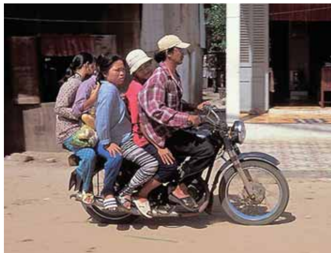
Fem på samme moped – og ingen med hjelm: Ta ikke sjansen på det samme.

– Det er viktig å rådføre seg med sin lege her hjemme før avreise. Generelt vil jeg si at man bør ta med seg medisin hjemmefra. Det gir mindre anledning til misforståelser, både språklige og praktiske. I enkelte land finnes piratmedisiner uten effekt eller i feilaktig mengde på markedet. Samtidig er det viktig for alle som bringer medisin med seg at de også kan fremvise attester fra lege eller apotek som bekrefter at dette er noe man trenger til eget bruk. Pass også på at du har ordnet med de nødvendige vaksinasjoner og forsikringer før du reiser.